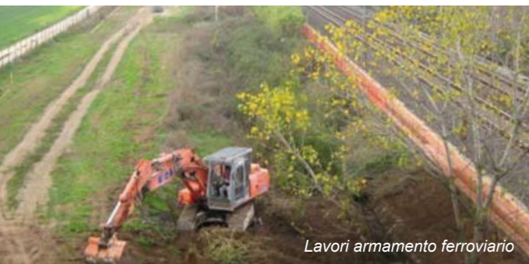
Lavori armamento ferroviario

Le opere realizzate sono: Edificio Direzionale (1.150 mq per piano articolato su tre livelli), Deposito ferro-gomma (5.000 mq dei 45.000 mq concessionati), Piazzale terminal-container (89.900 mq), Piazzale ferro gomma (40.000 mq dei 92.000 mq concessionati), Viabilità di collegamento allo svincolo sulla SS 76 e viabilità interna, Sottoservizi di pertinenza dell'area urbanizzata, Impianto di depurazione e canale scolmatore a fiume, Corpo stradale ferroviario (per tutto lo sviluppo dei fasci binari di allaccio ed interni), Prolungamento sottopasso ferroviario della Coppetella, Complesso della Nuova Chiesa della Coppetella e relativo piazzale di pertinenza, viabilità di cantiere.