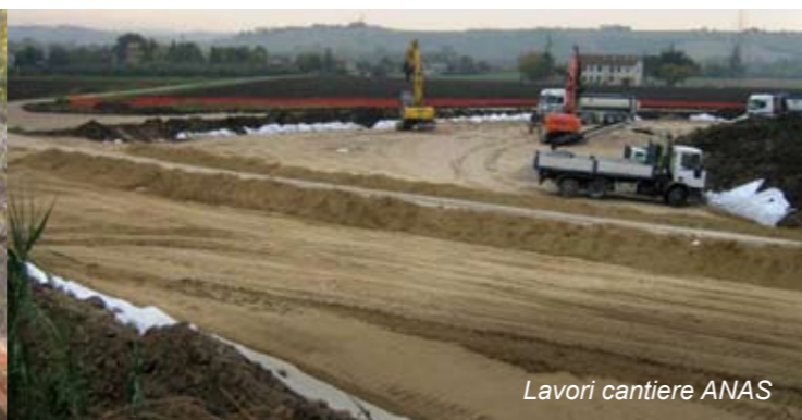
Lavori cantiere ANAS